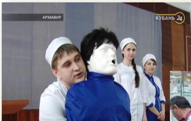
На Кубани стартовала акция "Неделя детского здоровья"