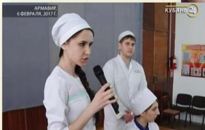
На Кубани в акции "Неделя детского здоровья" участвовали больше 500 тыс. человек